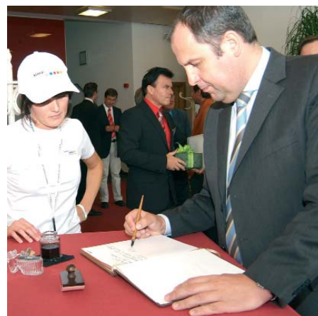
Minister Erwin Pröll verewigte sich im Firmenbuch