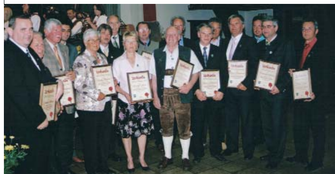
Die neuen Träger des Ehrenzeichens in Gold der Gemeinde Langkampfen.