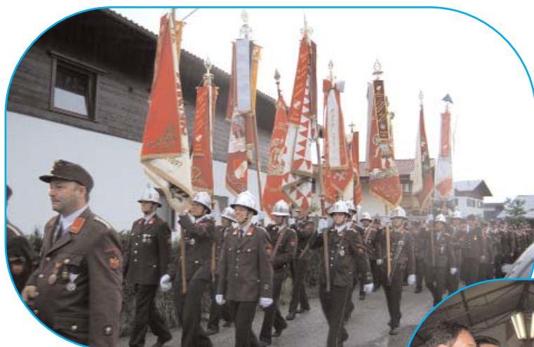
Einzug von der Schule zum Festplatz in Oberlangkampfen.