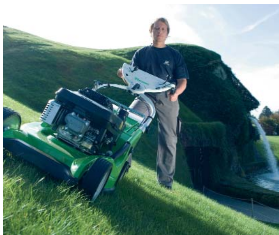
Auch den Swarovski-Riesen frisiert der Rasenmäher aus Langkampfen ohne Probleme.

Doch die Firma Viking setzt auf fachlich